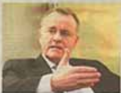
Landeshauptmann Niessl (SPÖ): Kritik an Innenministerin Fekter.

NIESSL: Das ist immerhin ein erster Schritt.